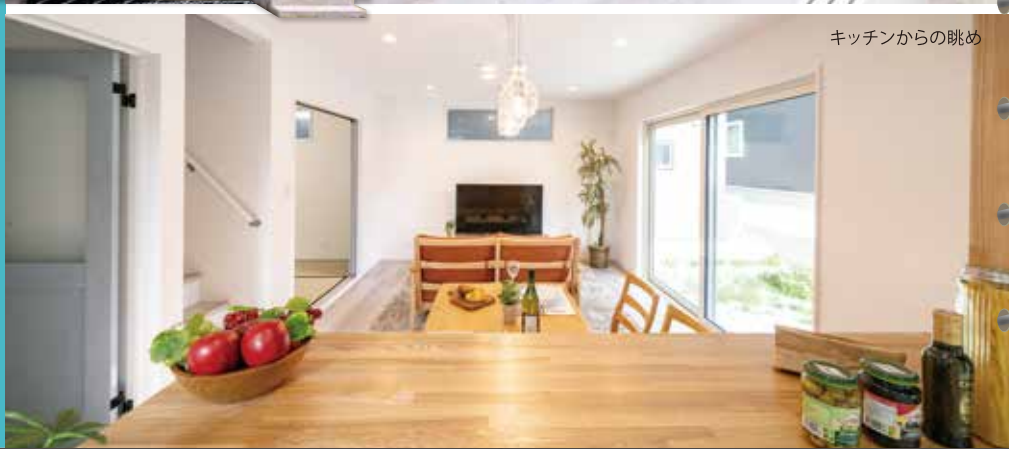
キッチンからの眺め