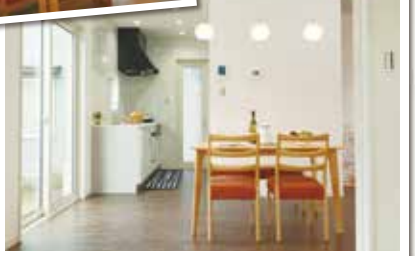
和室からキッチン